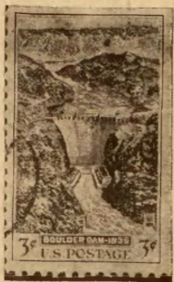
Amerykańska poczta wydała świeżo znaczki, wyobrażające słynną groblę Bulder na rzece Colorado.