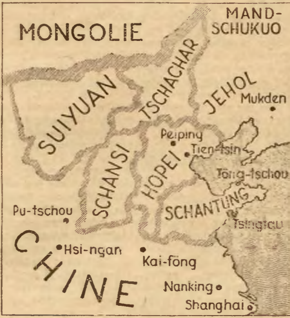
Mapka prowincji północno chińskich, które mają ogłosić niepodległość. Japonja wysłała tam znaczne oddziały, celem przeszkolenia interwencji rządu nankińskiego.

Szachar, Suiyuan, Hopei, Shansi, Shantung w jedną grupę autonomiczną, prawie tak wielką jak Mandżukuo. Japończycy w akcji swej będą