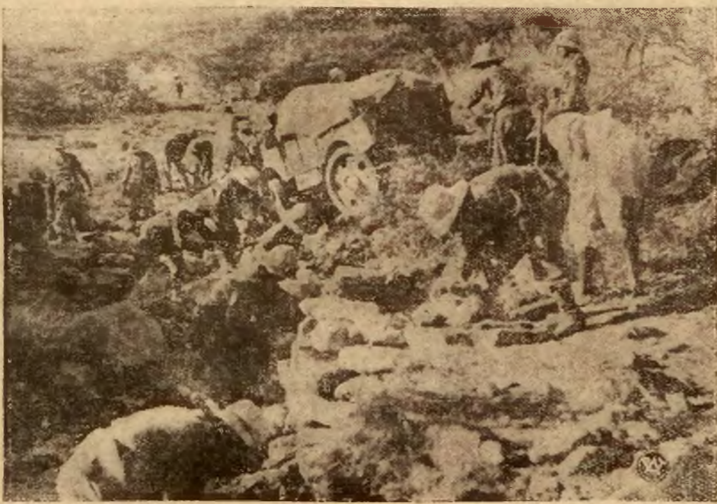
Przykładem trudności terenowych jakienapotykają wojska walczące w Abisynji służy powyższe zdjęcie, przedstawiające wojska włoskie, torujące drogę samochodowi ciężarowemu.