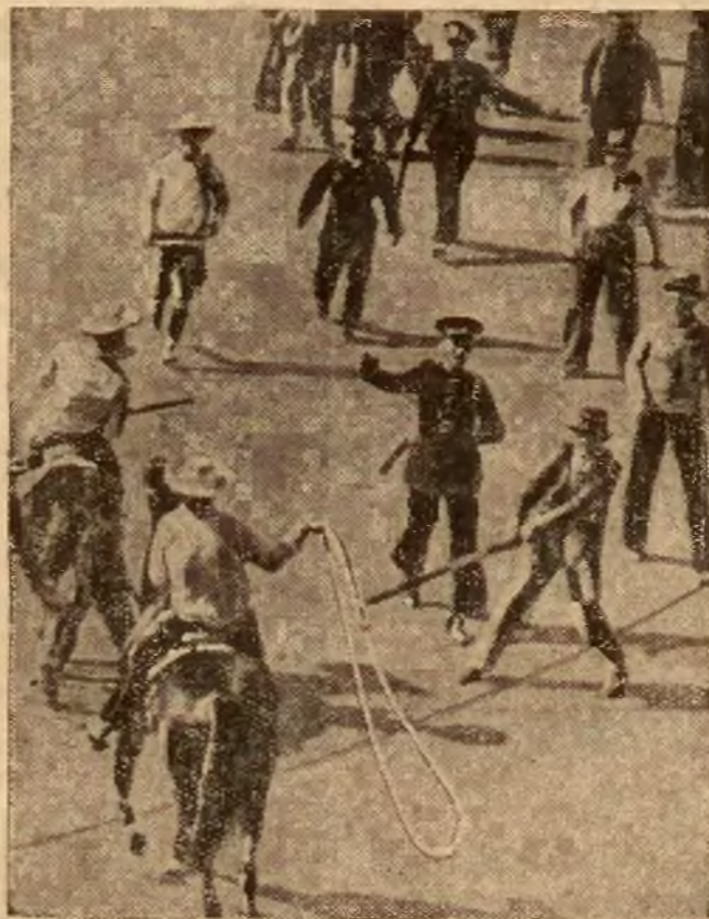
W 25 rocznicę rewolucji meksykańskiej urządzili tamtejsi komuniści rozruchy, które policja z trudem stłumiła.