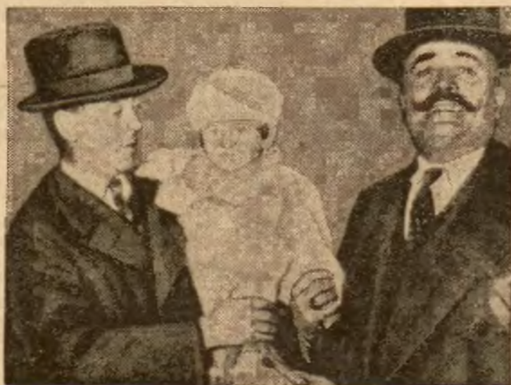
Na zdjęciu odnalezione dziecko na ręku policjanta.