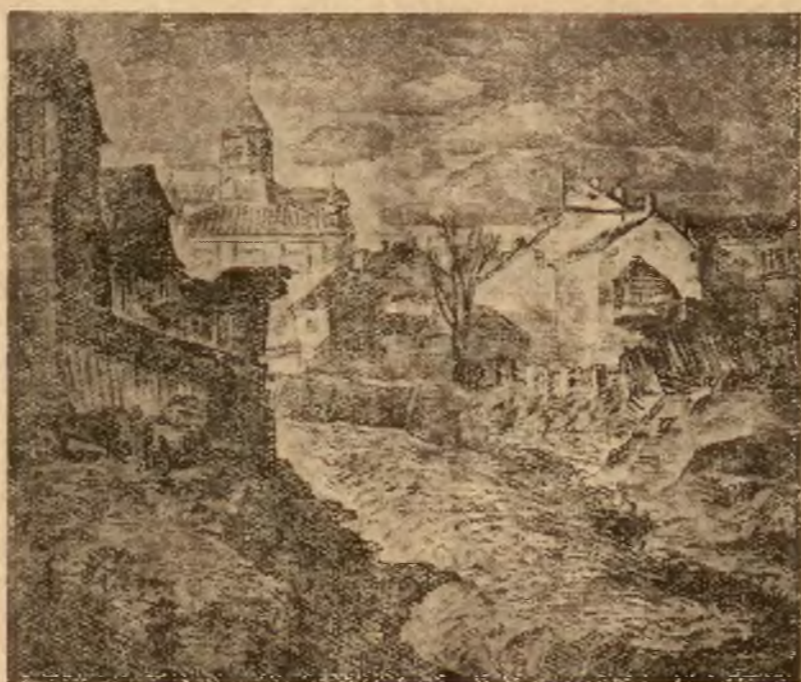
Lew Dobrzyński. Domy nad Wilenką — akwaforta, rozmiar 33x28 cena 7 zł.

Każda praca jest oryginałem, ponieważ po wykonaniu zamówienia klika ulegnie zniszczeniu. Prace oglądać można w oknie Redakcji „Słowa“, ul. Zamkowa 2 róg Królewskiej.