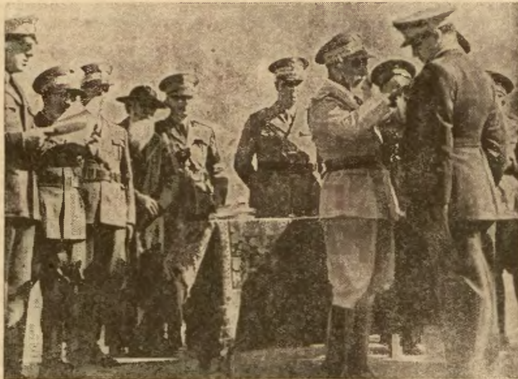
Przed wyjazdem z Afryki marszałek de Bono udekorował orderami kilku oficerów lotnictwa za zasługi bojowe. M. in. odznaczony został także zięć Mussoliniego hr. Ciano, dowódca słynnej eskadry „La Disperata”. — Ilustracja przedstawia dekorację hr. Ciano.