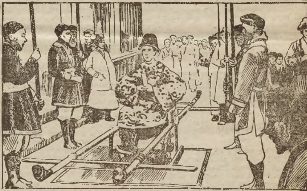
Cesarz Anamu podczas uroczystości w swoim pałacu — siedzi na złotym tronie.