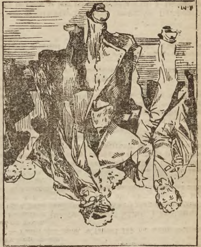
36 BIBLIOTEKA POWIEŚCI „WIEKU NOWEGO”