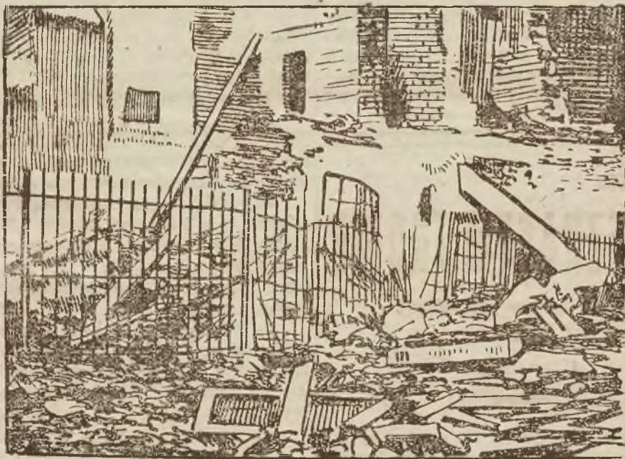
Słynny pawilon dziesiąty na Cytadeli warszawskiej przedstawia obecnie obraz strasznego zniszczenia. Niektóre części pawilonu leżą w gruzach. Rycina nasza przedstawia pawilon dziesiąty ze strony zew. ętrznej.