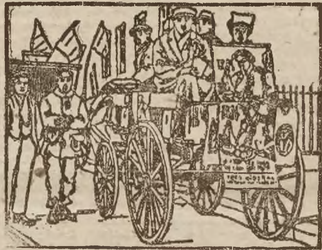
Walka wyborcza w Anglii.