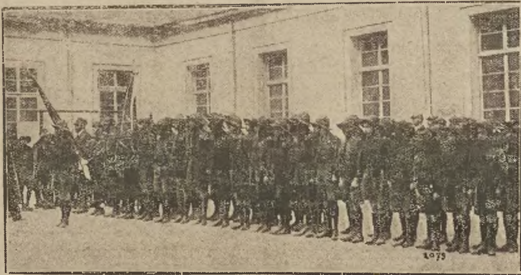
Piąta lwowska męska drużyna harcerska „Orląt“ z nowym sztandarem.