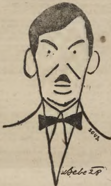
Minister Kwiatkowski, wybrany posłem z listy Nr. 1 we Lwowie.