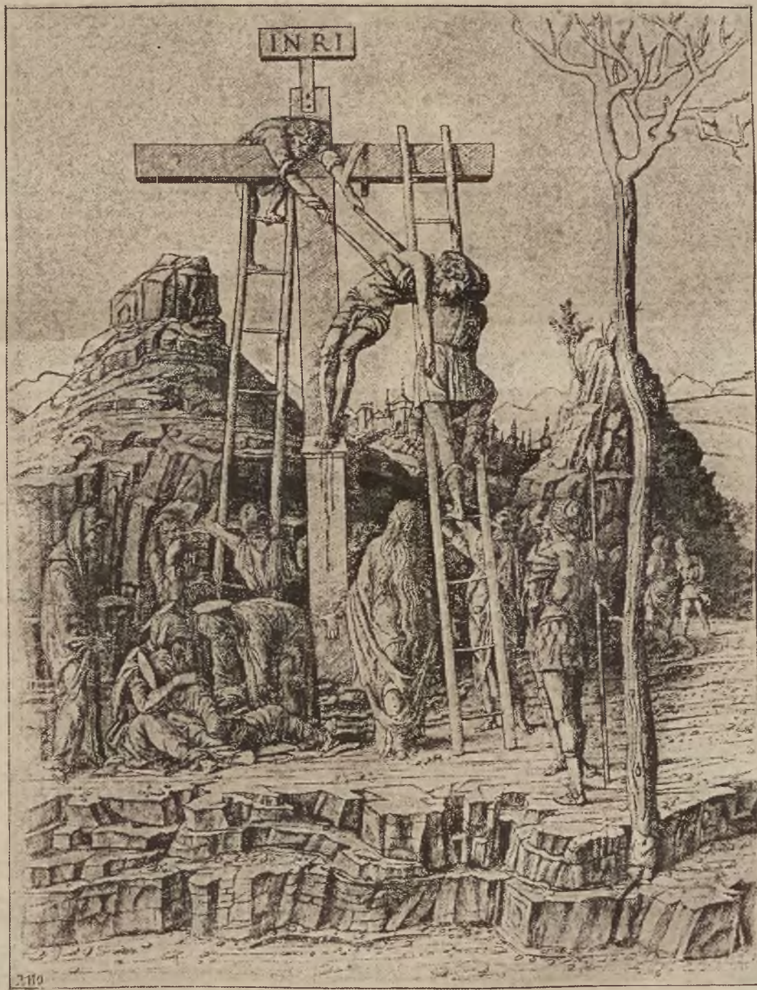
„ZDJĘCIE z KRZYŻA” podług obrazu Andrzeja Mantegnii, słynnego malarza włoskiego z XV. wieku. (1431 + 1506).