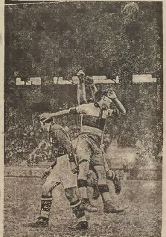
W rozegranym niedawno w Paryżu matchu Francja-Niemcy odnieśli zwycięstwo Francuzi, którzy okazali się doskonałymi technikami. Rycina nasza przedstawia moment z gry.