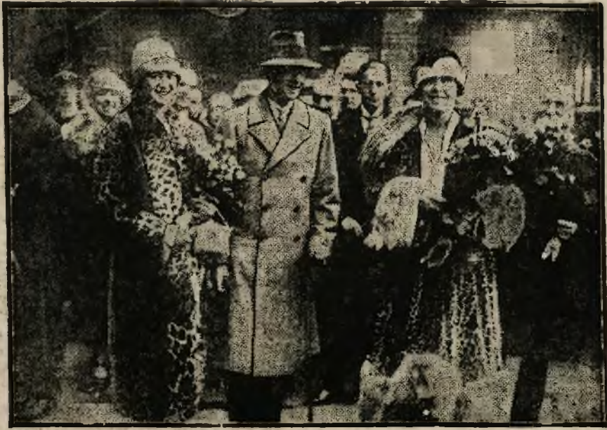
Królowa Maria rumuńska zatrzymała się na krótki pobyt w Paryżu, przed swoim odjazdem do Stanów Zjednoczonych. Obok królowej dzieci: córka księżniczka Ileana i syn książę Mikołaj.