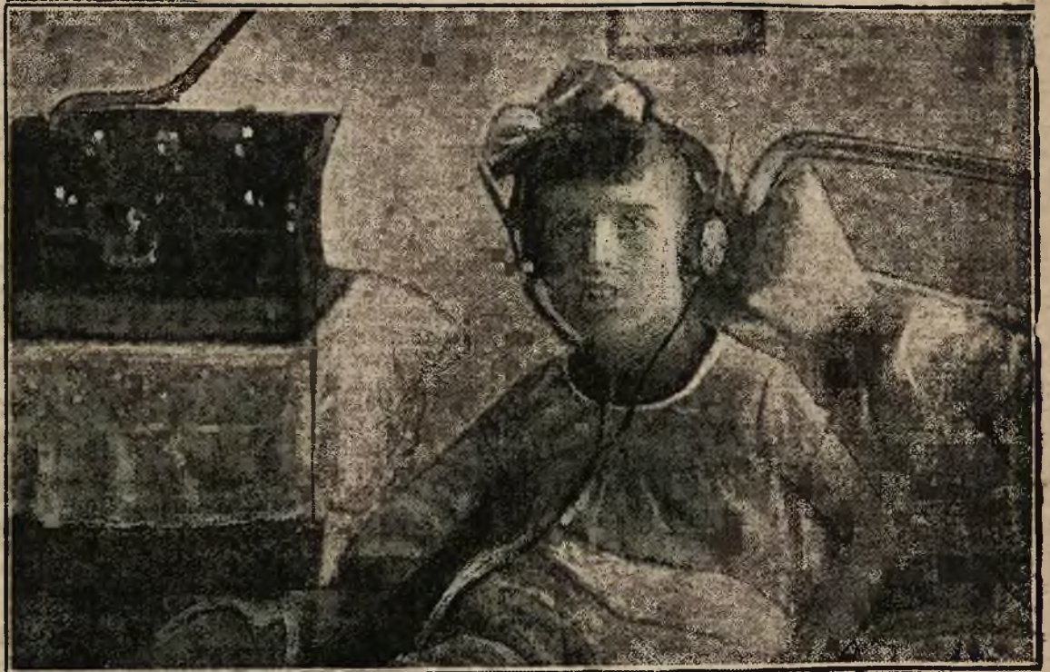
Malutka Kazia też uznaje radjo...

elegancką walizkę, był doskonale ubrany i robił wrażenie zamożnego młodzieńca. Otrzymał pokój na parterze. Umywszy się, wyszedł na miasto, na spacer. Około 8-mej wieczorem wrócił do hotelu, w sali restauracyjnej kazał sobie podać kolację, zjadł i polecił aby mu rachunek przysłano do numeru. O godzinie dwunastej w nocy usłyszał