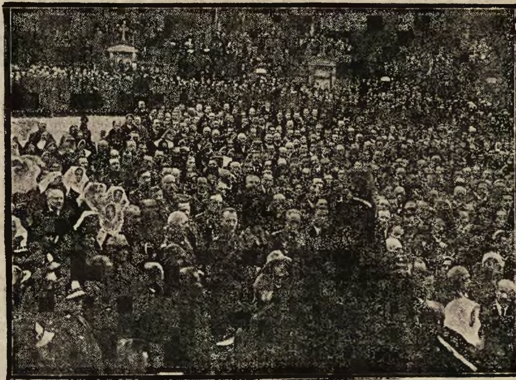
Pożegnanie zwłok na cmentarzu Łyczakowskim.