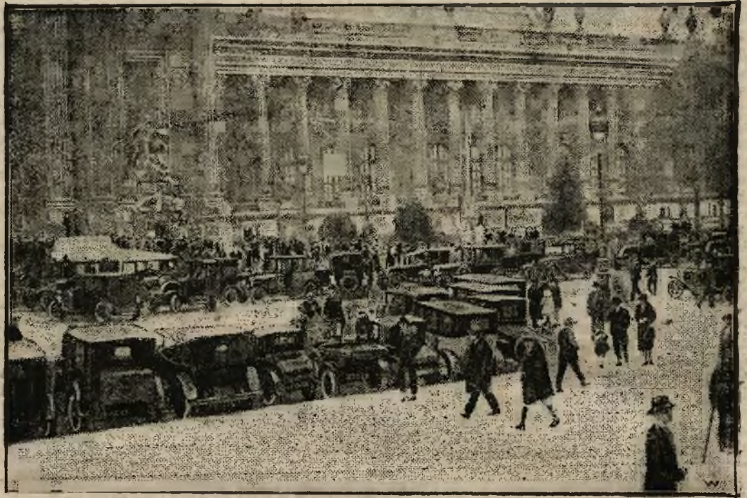
Wielka wystawa samochodowa w Grand Palais w Paryżu wywołała ogromne zainteresowanie. Rycina nasza przedstawia rewię samochodów przed wystawą.