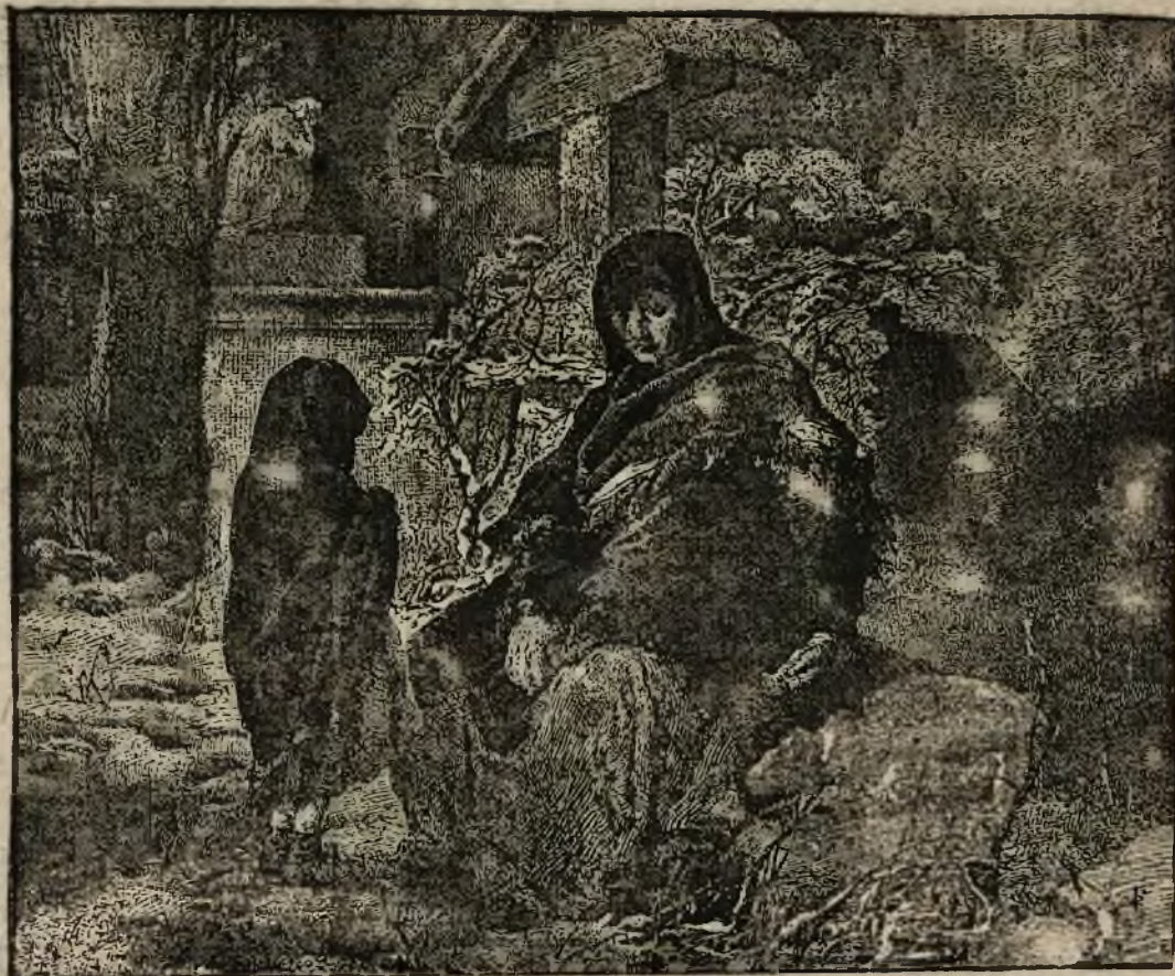
W dzień zaduszny. (Rysunek M. Andriollego).

Każdemu z nas, każdemu przyjdzie tutaj Za każdego się będzie ktoś modlił w Zaduszki! —