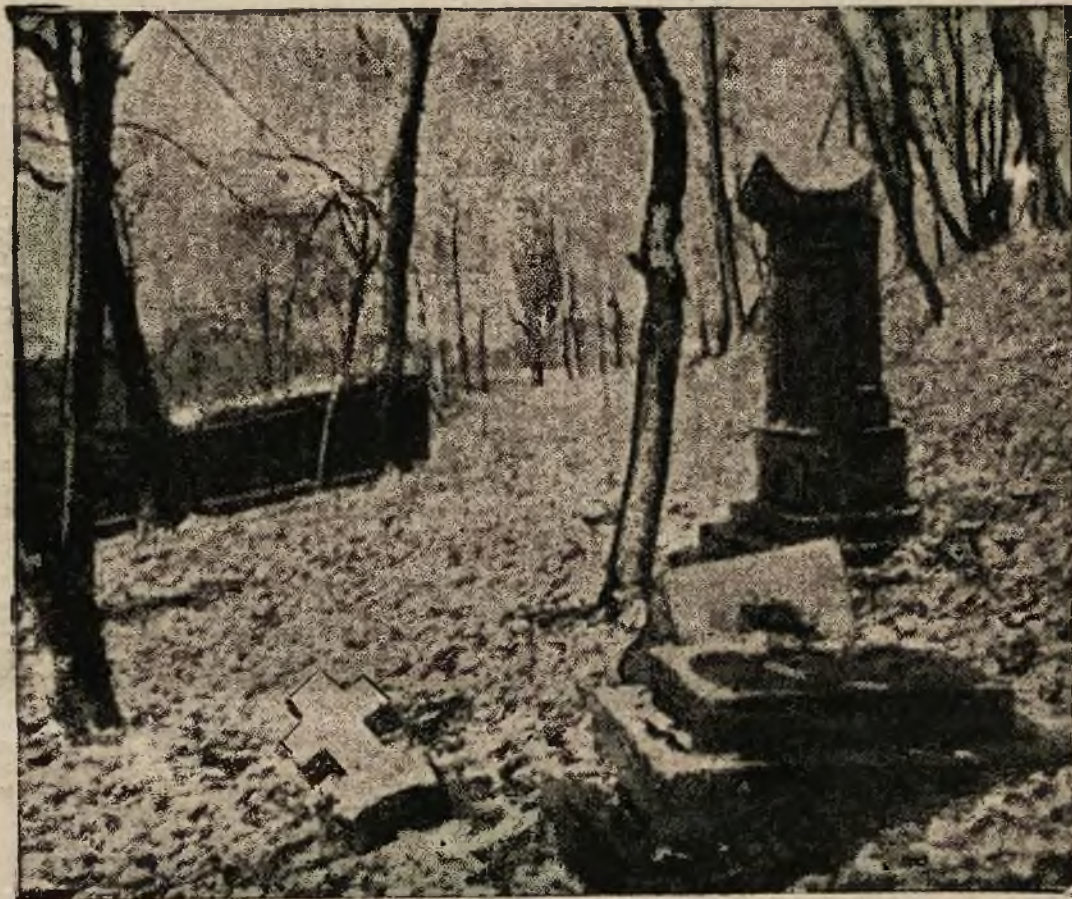
Fragment z dawnego cmentarza na Paparówce, z którego zachowały się dziś jedynie szczątki pomników i nieliczne głą y nagrobkowe.