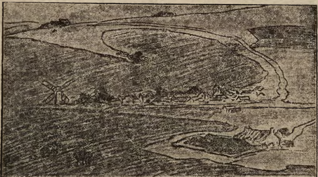
Ukryty pod tym pejzażem plan strategiczny.

Ściłym rysunkiem kredkowym inny rysunek, który okazał się nie mniej ni więcej... planem wspomnianej bazy marynarki Aljantów. Malarz był szpiegiem. Od szeregu już miesięcy pod postacią niewinnych rysunków przysyłał swym szefom do Szwajcarii dokładne plany okolicy i ważnych obiektów wojennych. Na śledztwie okazało się ponadto, że był rodowitym Niemcem, a z malarstwem łączyły go poza wiadomym zawodem węzły bardzo luźne.