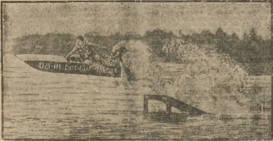
Jeden z amerykańskich sportowców zbudował skaczącą łódź motorową (nasza rycina) przy pomocy której z nieznaną dotąd szybkością pokonywuje morskie fale.