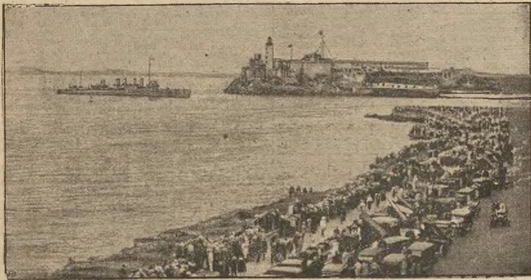
(xy) Jednym z większych portów w drodze do Ameryki południowej jest port w stolicy wyspy Kuby, w Hawannie. Rycina nasza przedstawia widok wjazdu do portu w Hawannie.

Swetery i Bielizna damska, męska, dziecinna, Bluzki, Szlafroczy, Podwiązki, Opaski, Artyk. dziecinne, Pledy, Kołdry, Ręczniki, Fartuszki i Berety szkolne 3.—, Płaszczki dziec. 25.—, Pończochy, Rękawiczki, Reformy itd. poleca naj- BATOREGO 6. UWAGA! Kombinacje jedwab. 6 zł., Biustniki 1'20, Pończochy jedw. do prania 3, oryg. „BEMBERG“ 6, Rękawiczki im. jelonki 3'50. Przyjezdnym polecamy się jako solidne i tanie źródło zakupna. 4849