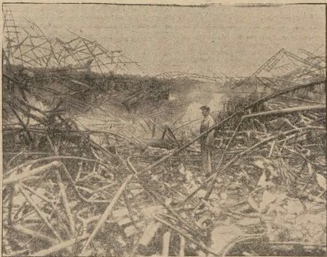
(xy) Rycina nasza przedstawia angielski sterowiec „R. 101“ po strasznej katastrofie, w której zginęło 46 osób. Jak widzimy, z większego statku powietrznego świata pozostały tylko powyginane i zmieszane z sobą szczątki metalowej konstrukcji sterowca.

Żądajcie tylko polskich uznanych za najlepsze