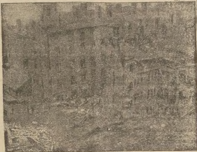
(xy) Ogólny widok miejsca katastrofy.

upływa nieodwołalnie z końcem bieżącego tygodnia.