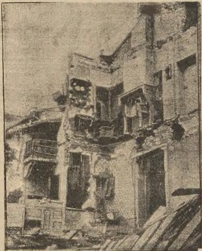
(xy) Jeden z domów przy ulicy Tramassac, zniszczonych w czasie strasznej katastrofy w Lyonie.