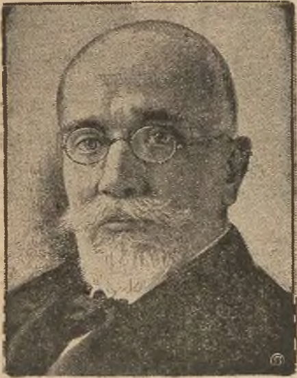
PREMIER GRECKI VENIZELOS.

licyjne zażądały zdemobilizowania armji greckiej, obsadziły port Pyreus i poddały swej kontroli poczty i telegraf, a w końcu, w maju 1917 r., zajęły zbrojnie Ateny i zmusiły króla Konstantyna do abdykacji i przekazania władzy następcy tronu, Aleksandrowi.