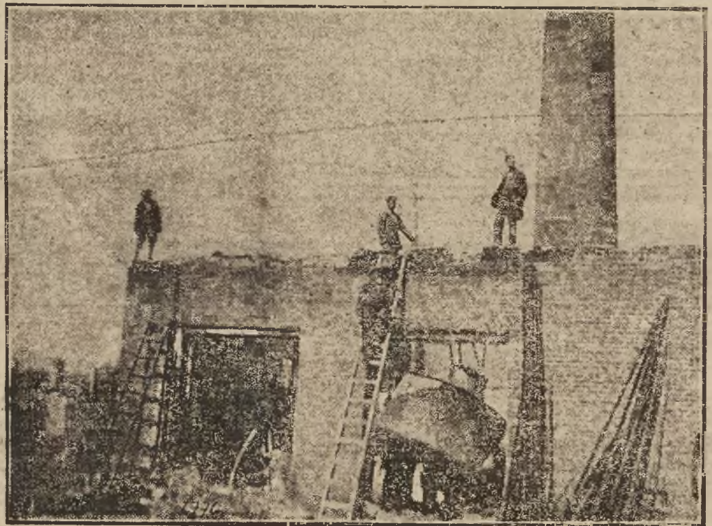
Pozostałe mury z kotłowni spalonego onegdaj tartaku „Rolindustria” na Lewandówce za rogatką Gródecką.