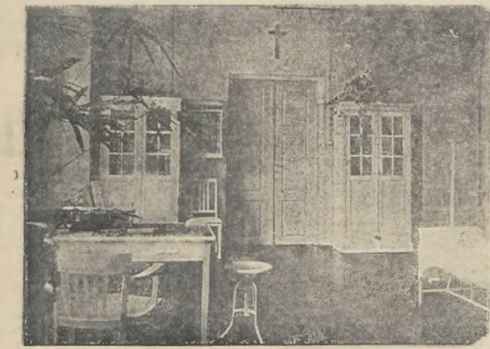
Jeden z gabinetów lekarskich.