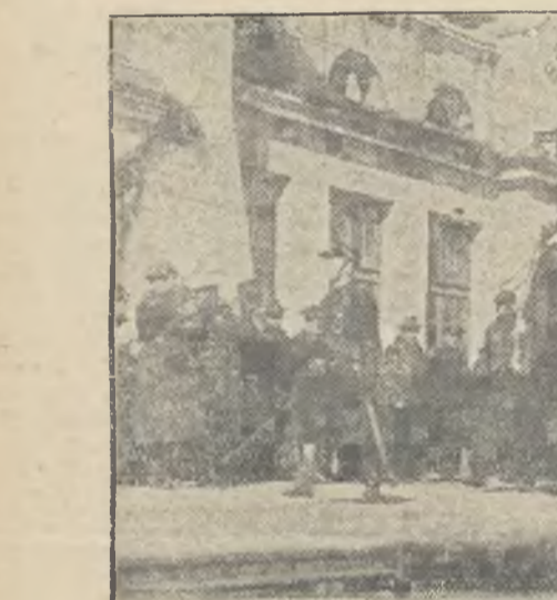
Przysposobienie Wojskowe Kolejarzy w Brześciu