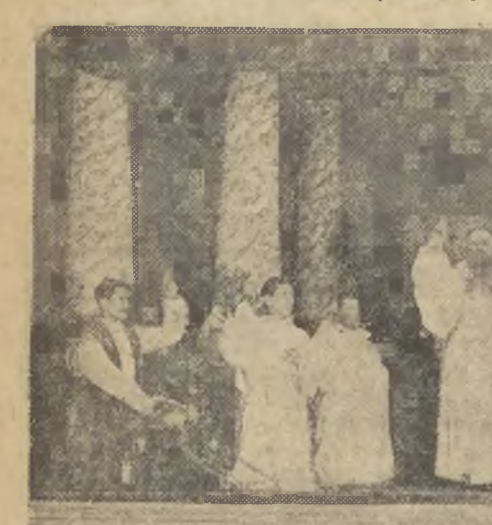
W klasztorze na Jasnej Górze