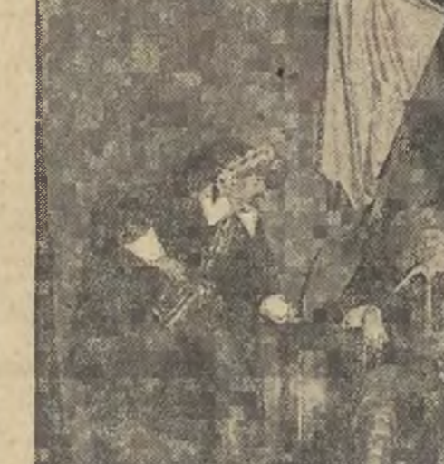
W obozie szwedzkim.