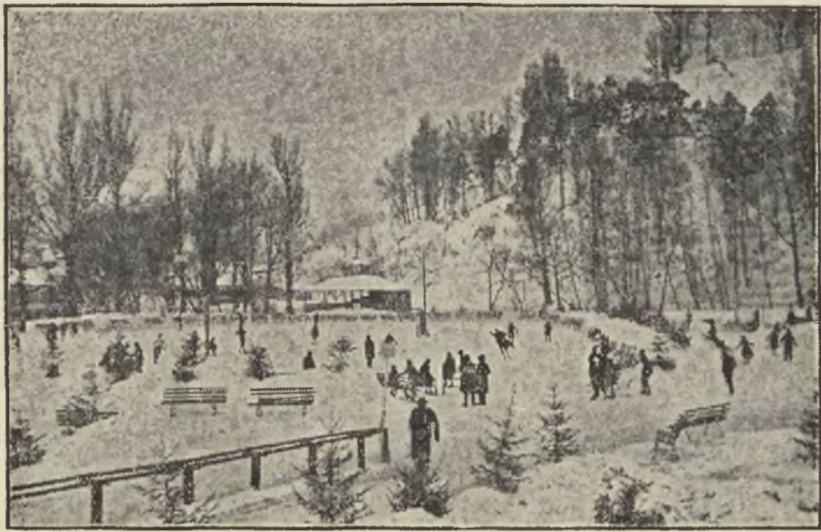
Ogólny rzut oka na ślizgawkę wileńską.

Cały tydzień pusto było w parku i dopiero znaczny spadek mrozu pozwolił stęsknionym sportowcom włożyć łyżwy. Jak widać na ilustracji, obejmujące niestety tylko gładki plac, niewiele jeszcze osób zaryzykowało opuścić ciepłe mieszkania, można jednak mieć nadzieję, że najbliższe dni przyniosą całkowity spadek mrozu — co zapewni łyżwiarce. Najbliższa niedziela przyniesie nam dwie imprezy łyżwiarskie: zawody o mistrzostwo Wilna, organizowane przez Wł. T-wa łyżwiarskie i zabawę na lodzie. Będzie to zabawa sportowa na miejsce „kar-