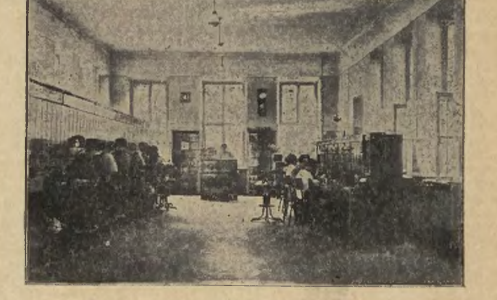
Sala główna Wil. Centrali Telefon.

Na parterze w dużej sali właściwa centrala. Tutaj skupiają się przewody. Wielkie szafy otwarte a w nich instalacja bezpieczników. Z jednej strony bezpiecznika abonent, z drugiej telefonistka. Niech między abonentem a bezpiecznikiem centrali trafi intruz w postaci np. przewodu o wysokim napięciu elektrycznym, bezpiecznik spala i p telefonistka żadna krzywdy się nie dzieje. Abonentowi także bo ma bezpiecznik w domu.