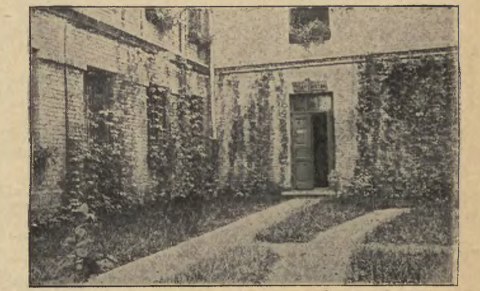
Wejście do Wileńskiej Centrali Telefonicznej.