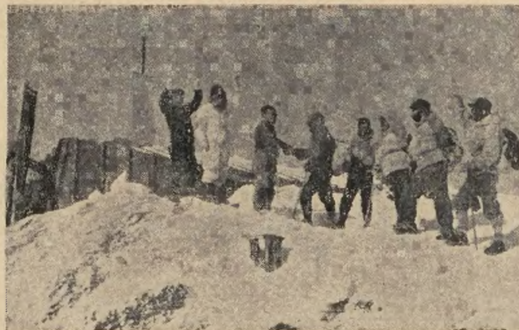
Członkowie japońskiego Centralnego Obserwatorium Meteorologicznego dokonują co pewien czas zmiany obsługi na szczycie góry Fudzi. Jak wiadomo, obsługa ta przeżyła ze stacji meteorologicznej na szczycie góry Fudzi codzienne biuletyny meteorologiczne do Tokio. — Rycina nasza przedstawia moment zmiany obsługi na szczycie Fudzi: nowa obsługa wita się z obsługą, która po oddaniu służby w obserwatorium wróci do Tokio.