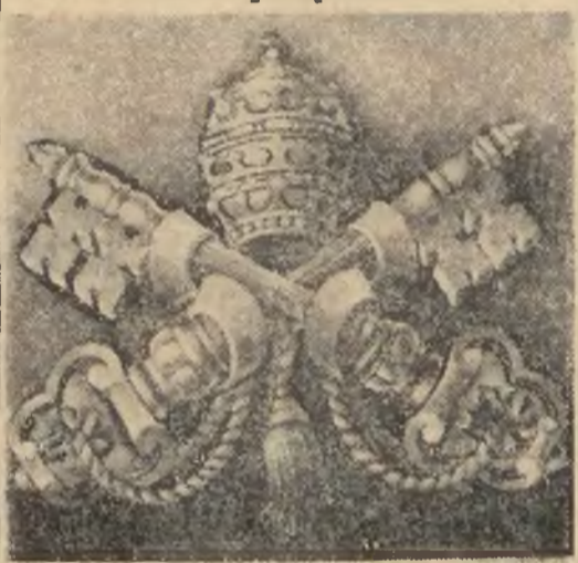
W związku z zbliżającym się terminem conclave, reproduujemy herb papieski.