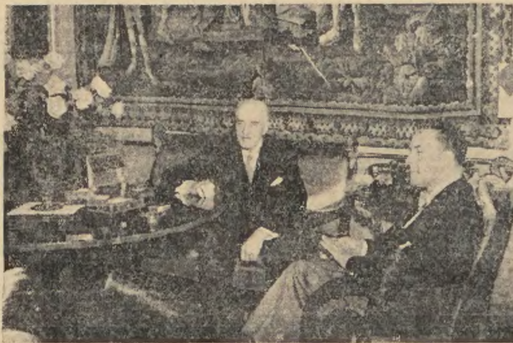
Włoski minister hr. Ciano na audiencji u Pana Prezydenta R. P. na Zamku królewskim.

Tak pięknego filmu jeszcze nie widzieliście!!! Tak pisze cała prasa paryska i londyńska o najnowszym superfilmie wg. E. REMARQUA