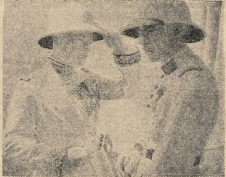
Do Dżibuti przybył onegdaj nowy dowódca naczelny francuskiego Somali, general Legentilhomme (z lewej strony), którego powitał pułkownik Truffer, dotychczasowy dowódca wojsk francuskich w Somali (z prawej strony).