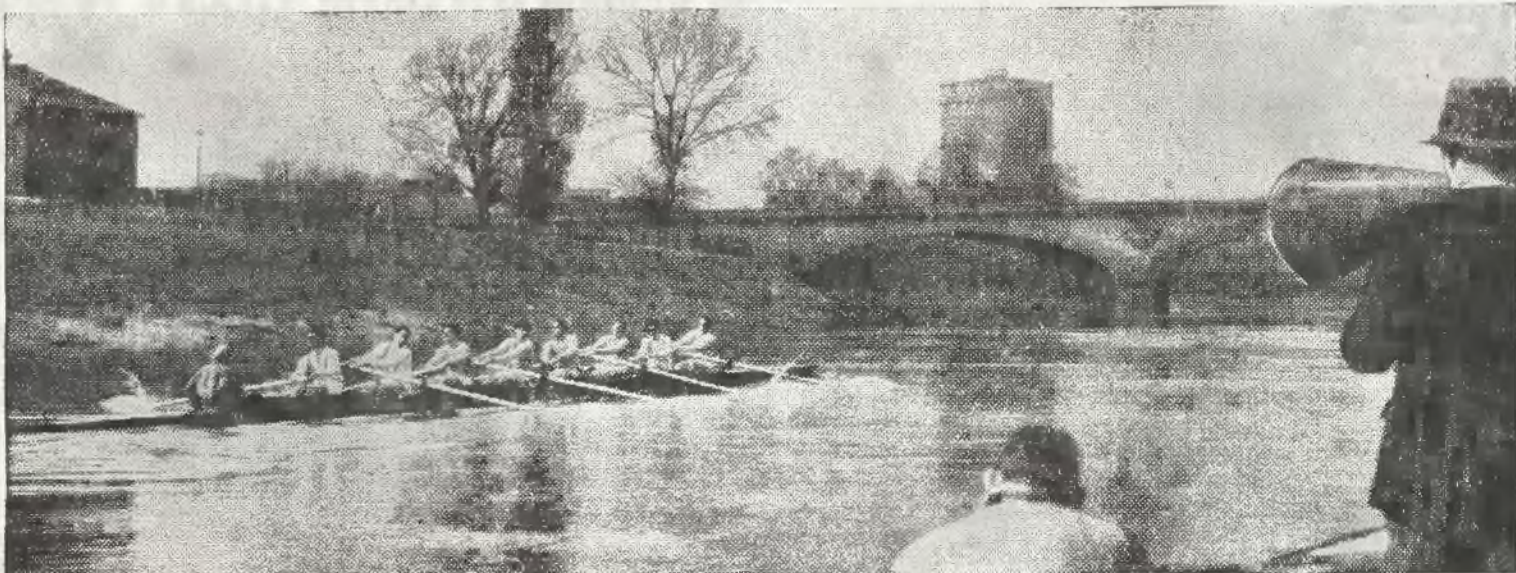
Przygotowania do tegorocznych regat Oxford — Cambridge są już w pełnym toku. Na zdjęciu ósemka Cambridge, która w ostatnich latach stale wygrywała. Z łodzi towarzyszącej trener wypowiada swoje uwagi prze z tubę.