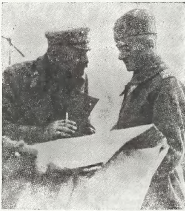
Zdjęcie przedstawia Marszałka z obecnym Generalnym Inspektorem Sił Zbrojnych gen. Rydzowi - Śmigłemu. Rydz - Śmigły w mundurach polo