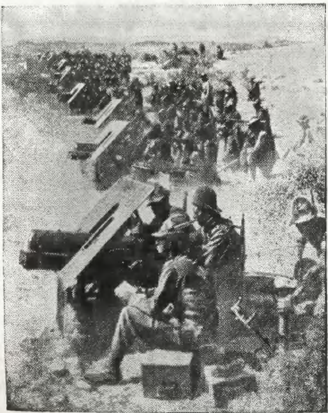
ARTYLERJA WŁOSKA NA POZYCJI.

Urzednicy banku abisynijskiego bronią dotychczas skutecznie banku przed zbrojnymi bandami. Poselstwo amerykańskie uznało, że dalsze utrzymanie się w jego siedzibie jest niemożliwe i przeprowadza ewakuację poselstwa przy pomocy samochodów ciężarowych, przysyłanych z poselstwa brytyjskiego. Trzech Europejczyków stawiało mężny opór zbrojnym bandom do czasu wyczerpania zapasów amunicji, poczem zdołali oni przedrzeć się do samochodu ciężarowego, przybyłego im z pomocą. 25 napastników zostało zabitych. W mieście wybuchły nowe pożary. Znaczna część środkowej części miasta uległa całkowitemu zniszczeniu.