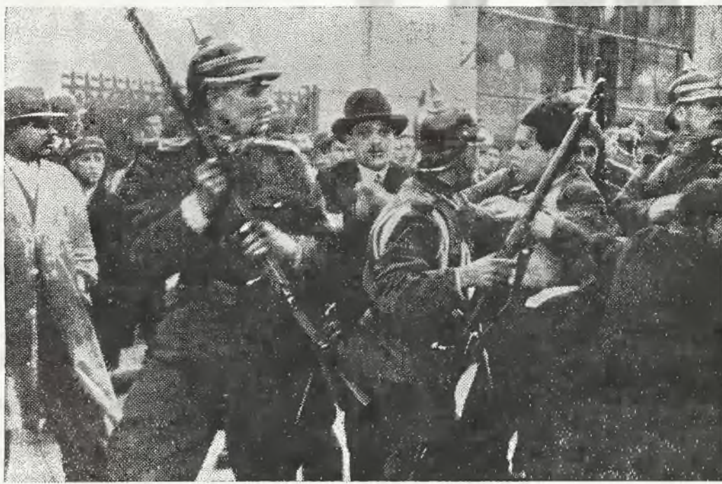
Mecz piłkarski wywołał w Bukareszcie zaburzenia antysemickie, tak ostre, że okazała się konieczna interwencja wojska.