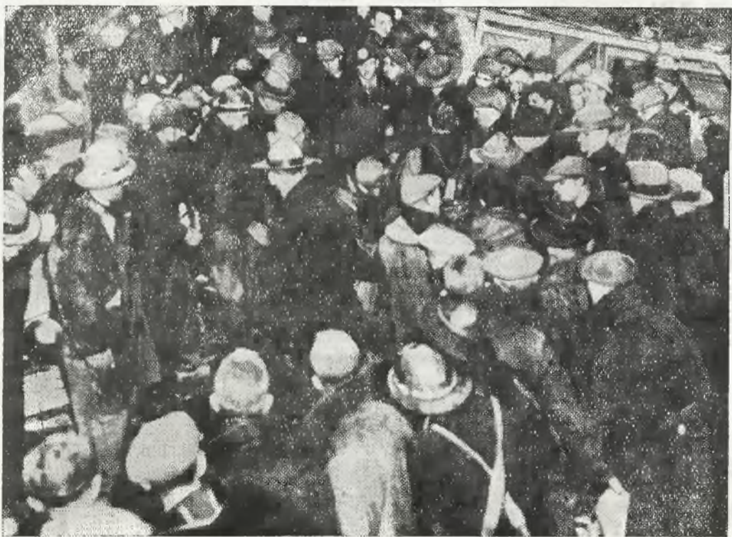
Grupa górników, zasypanych w kopalni, po jej uratowaniu po dziesięciu dniowym przebywaniu pod ziemią.