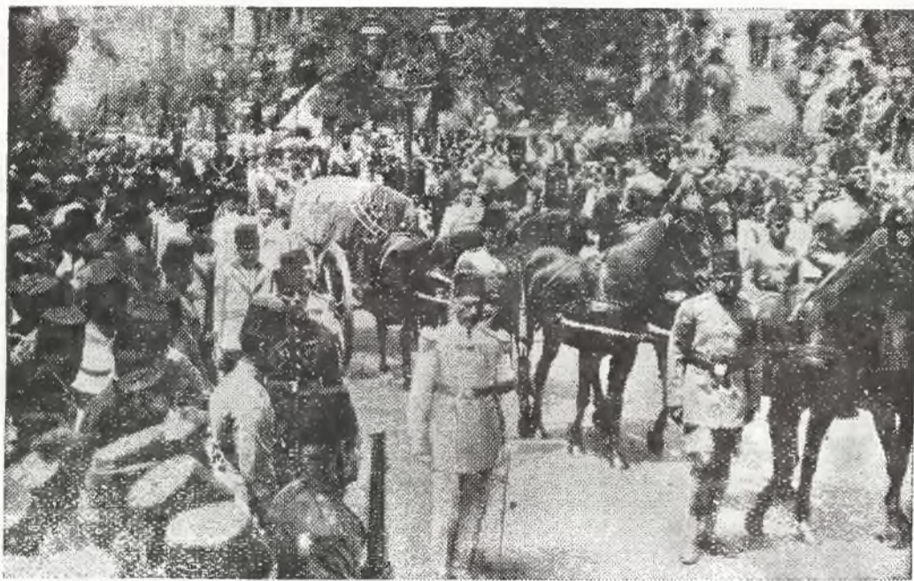
Zdjęcie z pogrzebu króla Fuada w Kairze.