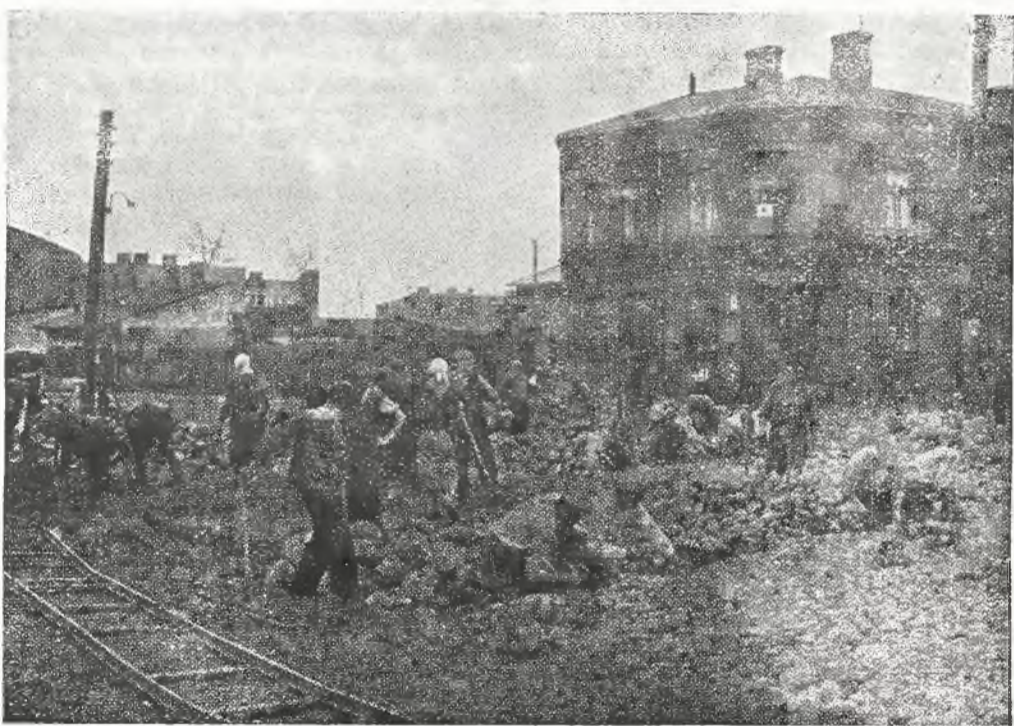
W całym kraju rozpoczęto szereg po ważnych robót inwestycyjnych z kredytów Funduszu Pracy. Zdjęcie na sze przedstawia fragment tych robót przy bukowaniu rynku w Żyrardowie