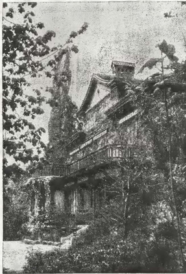
Willa nad jeziorem genezewskim, którą b. cesarz Haile Selassie nabył w ubiegłym roku dla swej córki.