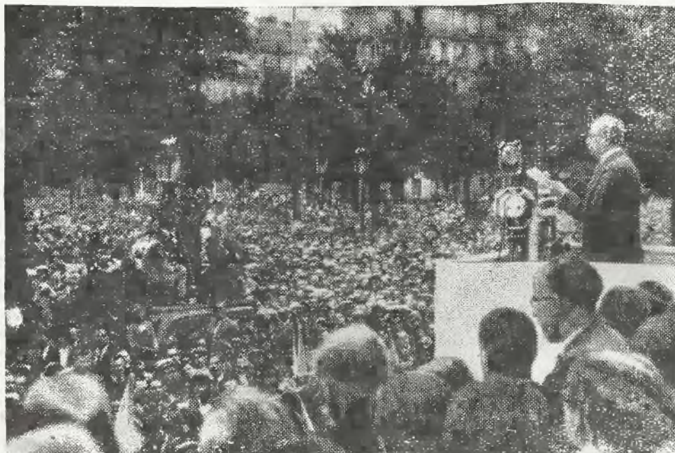
W dniu Święta Narodowego urządził „Front Ludowy” we Francji wielką demonstrację na Placu Bastylji. Prezydent ministrów Blum wygłosił przy tej okazji mowę, transmitowaną przez radio.