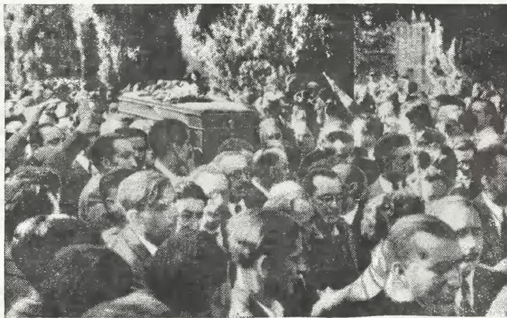
Wśród tłumnego udziału monarchistów odbył się w Madrycie pogrzeb przywódcy prawicy hiszpańskiej Calvo Sotelo.