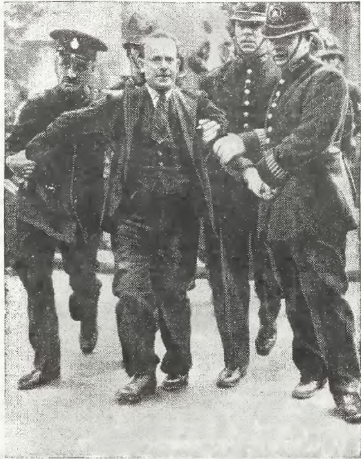
ZAMACHOWIEC NA KRÓLA ANielskiego