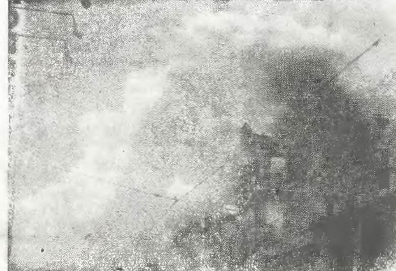
Zdjęcie przedstawia jeden z codziennych i zwyczajnych widoków dzisiejszej Hiszpanii, a mianowicie płonący kościół. Jak wiadomo socjaliści i komuniści podpalili setki kościołów w zajmowanych przez siebie prowincjach