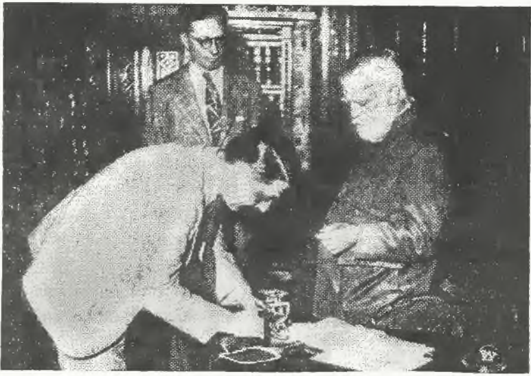
Zdjęcie przedstawia szefa hiszpańskiej rewolucyjnej junty rządowej w Burgos gen. Caballeros, w jego głównej kwaterze prowizorycznego rządu.