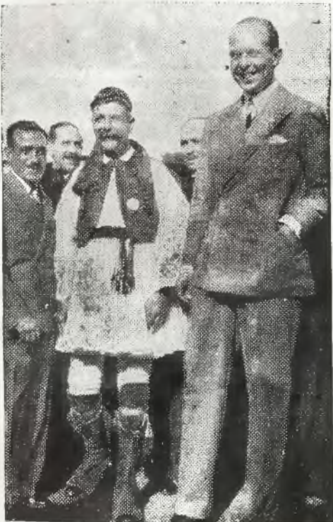
Grecki następca tronu książę Paweł, prezes greckiego komitetu olimpijskiego przybył na lotnisko w Berlinie. Obok księcia grecki zwycięzca maratona z roku 1896 Spirydjon Lewis.