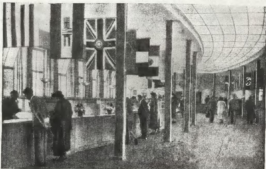
Rozmównica we wsi olimpijskiej, gdzie muszą się zgłaszać wszyscy odwiedzający zawodników.