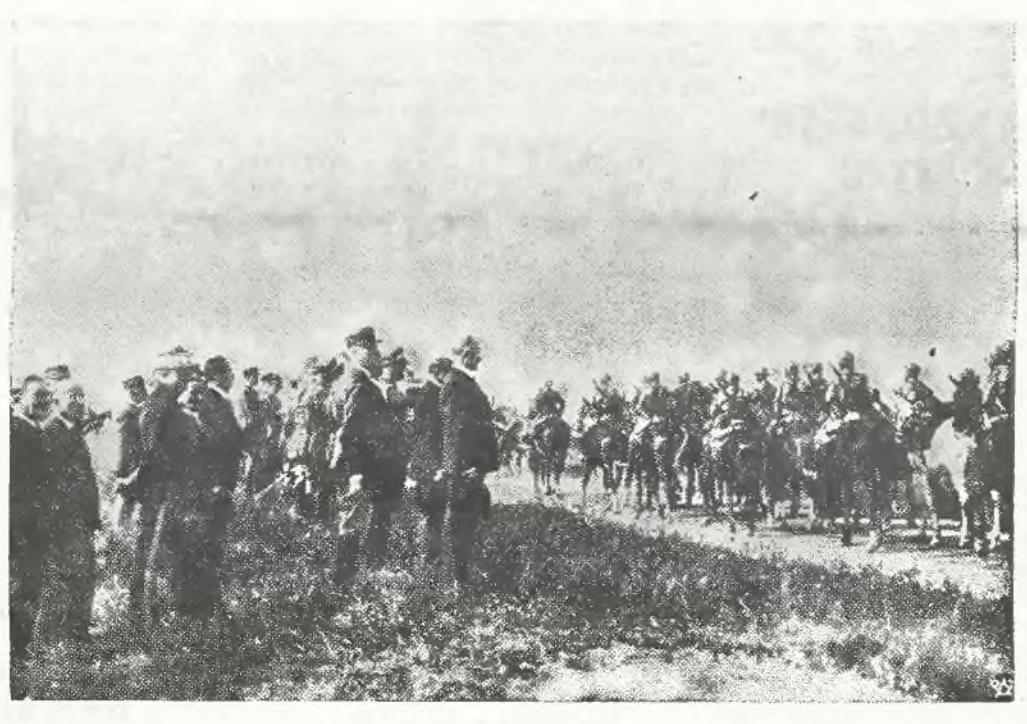
Zdjęcie przedstawia moment defilady kawalerji francuskiej na terenie obozu manewrowego Suippes w niedalekiej odległości od Chalonsur Marne.