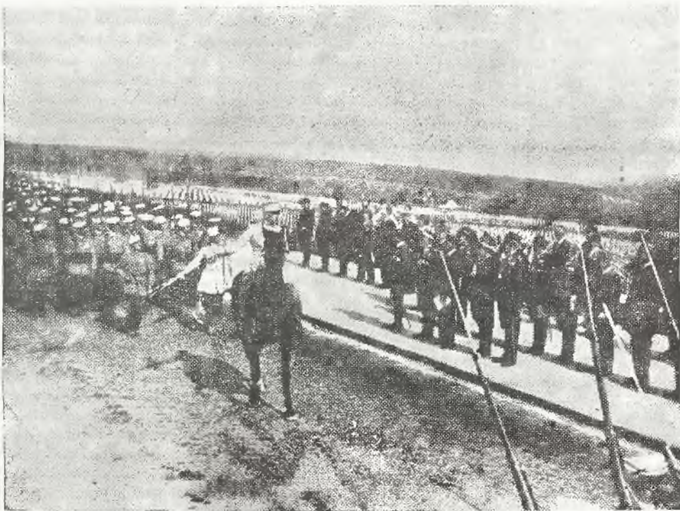
Zdjęcie przedstawia fragment defilady manewrujących oddziałów francuskich przed Naczelnym Wodzem Wojsk Polskich gen. Rydzem - Smigłym w towarzystwie gen. Gamelin, przed cmentarzem poległych w Douaumont.