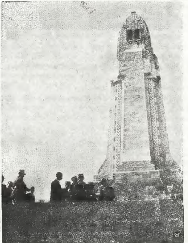
Zdjęcie przedstawia gen. Rydza-Śmigłego wraz z otoczeniem na stopniach mauzoleum ku czci poległych w Douaumont.