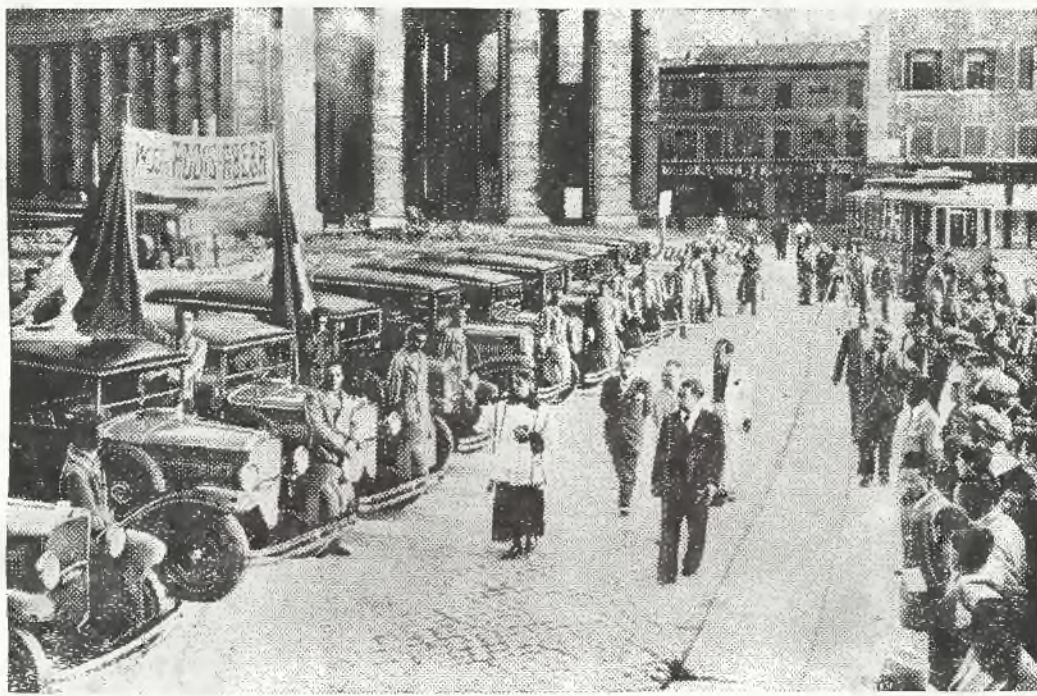
Przed wywiezieniem taksówek przeznaczonych dla Addis Abeby, zostały one w Rzymie pobłogosławione.