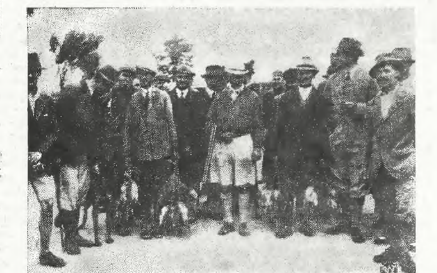
Podczas pobytu w Austrii król angielski Edward VIII wziął udział w towarzystwie posła angielskiego w Wiedniu w polowaniu, zorganizowanem dla króla w Dolnej Austrii.