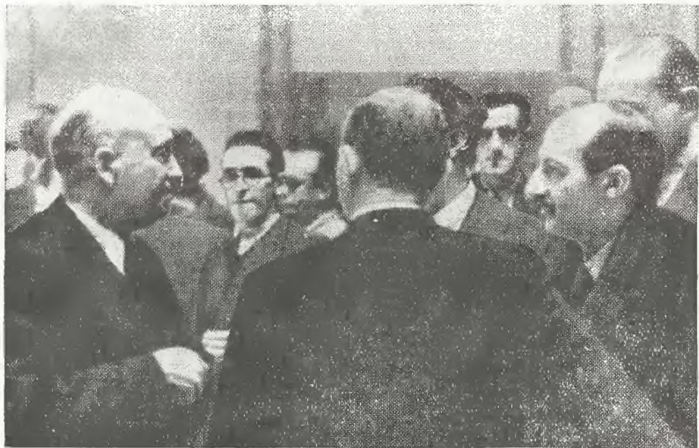
Largo Caballero i ambasador sowiecki Rosenberg (na prawo z profilu) omawiają wytworzoną sytuację.