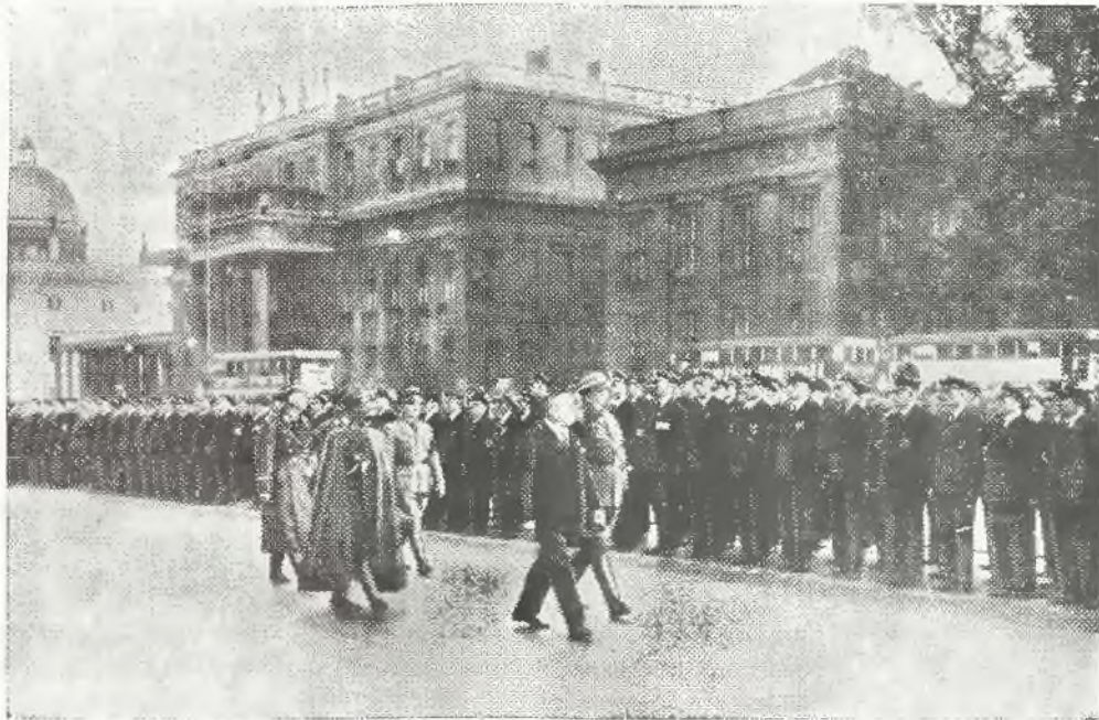
Delegacja polska przechodzi przed frontem uczestników wojny.