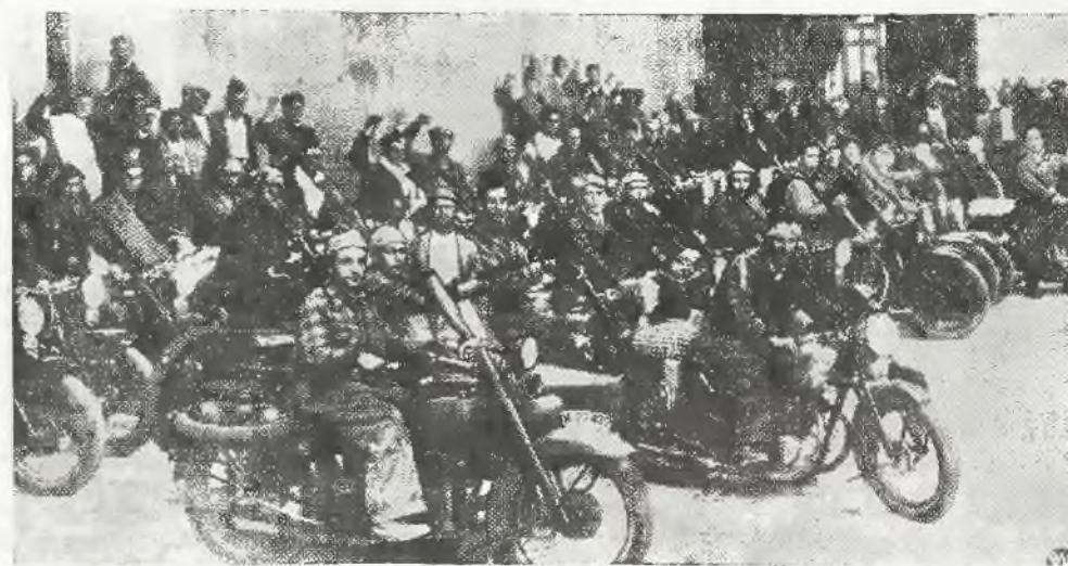
Fotografia przedstawia znotoryzowany oddział żołnierzy gen. Franco.