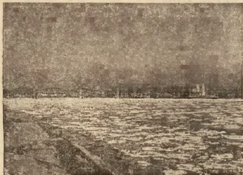
Na fotografii widzimy Wisłę oraz widok na most ks. Józefa Poniatowskiego. Na rzece z powodu ostatnich mrozów płynie gęsta kora.