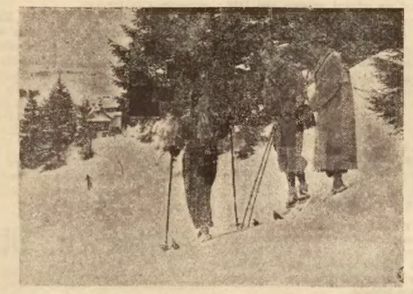
Przedem na wywczasach w Krynczy. Na fotografii naszej widzimy księżnę Juljanę z małżonkiem na nartach podczas rozmowy w chwili odpoczynku.