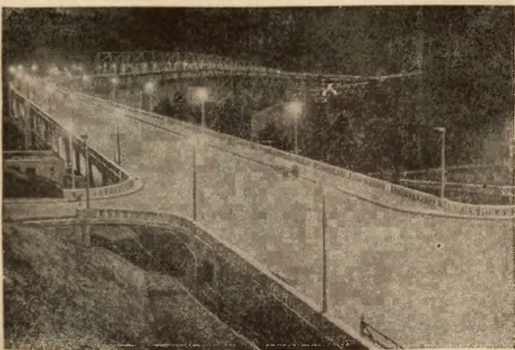
Most Oakland pod San Francisco.