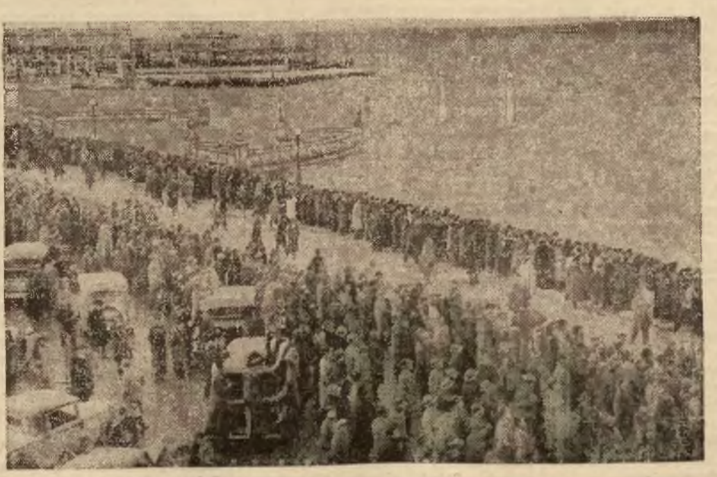
Ludność stołey Portugalji obserwuje powódź, powstałą nagle wskutek ulew, połączonej z cyklonem.