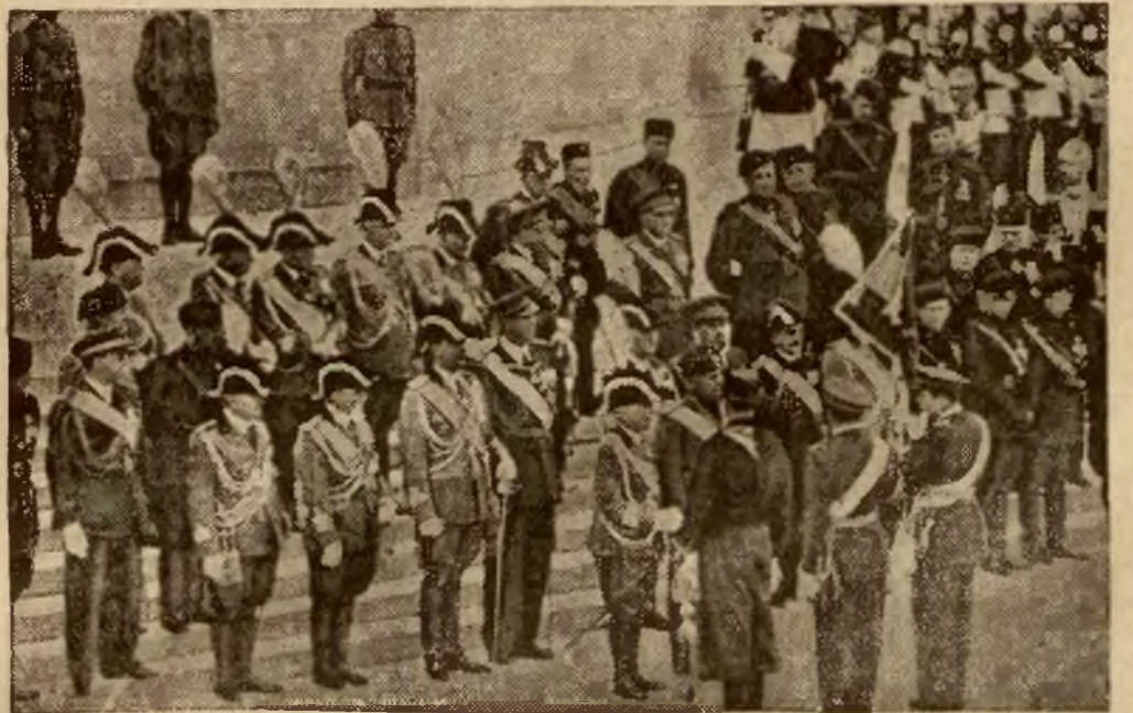
Z okazji 14-lecia wojskowego lotnictwa wojskowego, odbyła się w Rzymie uroczysta defilada lotników, przed królem Emanuelem i Mussolinim.