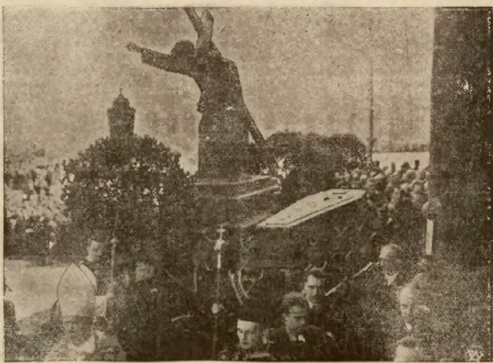
Fragment z eksportacji trumny z kościoła św. Krzyża