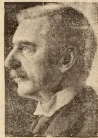
Mr. Neville Chamberlain obejmie agendy premiera po ustąpieniu Baldwina.