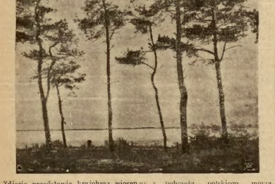
Zdjęcie przedstawia krajobraz wiosenny z pobraża polskiego morza.

Polskie przedwiośnie Ostatnie dni zaznaczyły się wybitnym ociepleniem. Odżyła przyroda, drze w pałęły pierwsze pąki, zwiastując przedwiośnie. Ten przedbrząsk nadchodzący wiosny zmienił barwę naszego życia, które stało się jakiegoś rodzaju, oczarowane wiosennym promieniem słońca.