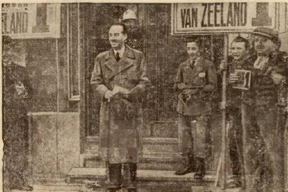
Premier Van Zeeland, po zwycięstwie nad Degrellem, opuszcza lokal wyborczy