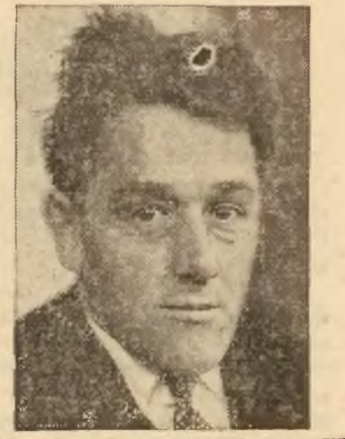
Komitet... w Paryżu na rozkaz kominternu, oświadczył, że do Moskwy nie powróci i zerwał z paryską partją komunistyczną

z kapitałem 20 — 25.000 zł. dla rozszerzenia fabrykacji poszukiwan. Wład. Biuro Ośrożeń J. Karlin, Niemiecka 35, tel. 605