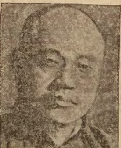
Na Dalekim wschodzie rozgorzała się wojna. Jedną z jej głównych postaci jest generał Sung - Cze - Yucian, który został mianowany przez rząd nankijski dowódcą wojsk chińskich pod Pekinem