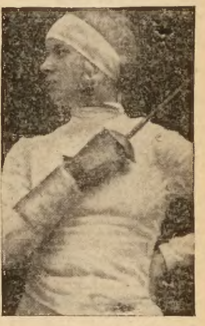
Mistrzostwo świata we florecie zdobyła w Paryżu Helfna Mayer