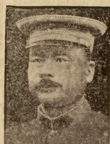
DOWÓDCA WOJSK POŁNOCNO - CHIŃSKICH chrześcijański generał Feng, znany ze swego wrogoego usposobienia wobec Japończyków.