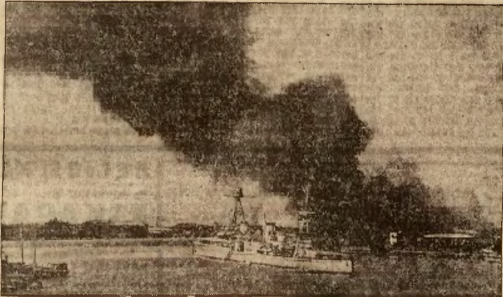
Pożar morskich urzędów celnych w Szanghaju. Na pierwszym planie krążownik amerykański „Augusta“