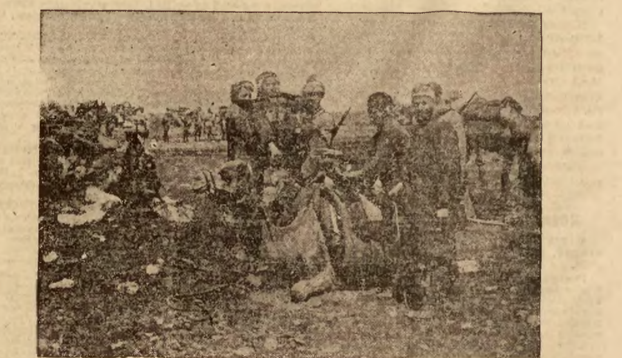
Wahabicy na granicy Palestyny