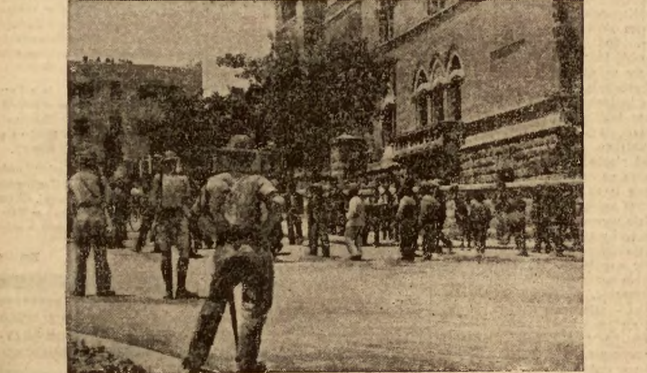
Posterunek policji angielskiej na jednej z ulic Jeruzolimy