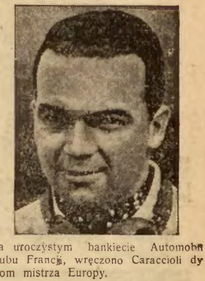
Na uroczystym bankiecie Automobklubu Francji, wręczono Caraccioli dyplom mistrza Europy.