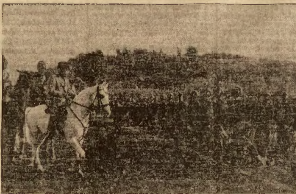
Z okazji dwunastolecia policji włoskiej odbyły się w Rzymie wielkie uroczystości. Na zdjęciu Mussolini czyni przegląd oddziałów z psami policyjnymi na polach Villa Glori.