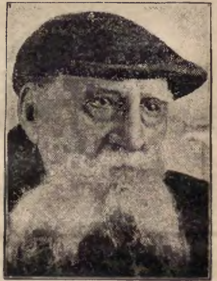
wybitny pisarz rosyjski, przebywający na emigracji w Pradze, ukończył 6. bm. 85 lat życia.