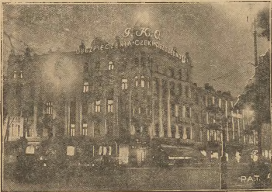
Stolica nasza w latach ostatnich upodobniła się zupełnie do wielkich miast Zachodu. Efektowne reklamy świetlne na dachach olbrzymich kamieni robią imponujące wrażenie. —