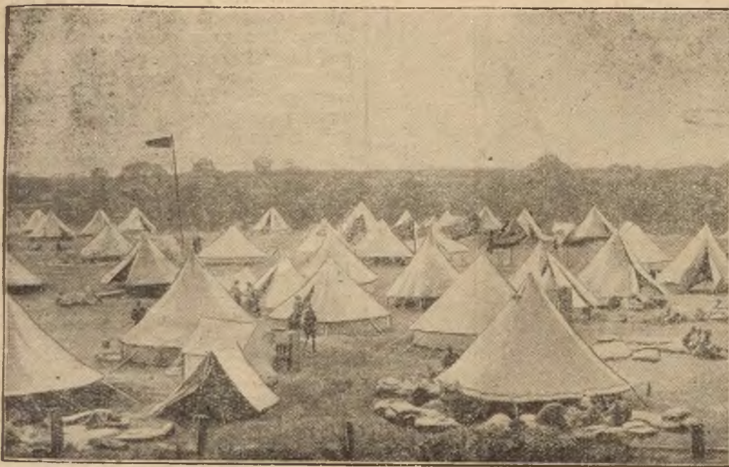
Koło Travemünde nad Zatoką łubecką założono letni obóz dla dzieci — składający się z namiotów. W obozie tym znalazło pomieszczenie 2300 dzieci. Zarząd i kontrola nad tym oryginalnym letniskiem spoczywa w ręku młodocianych jego mieszkańców.