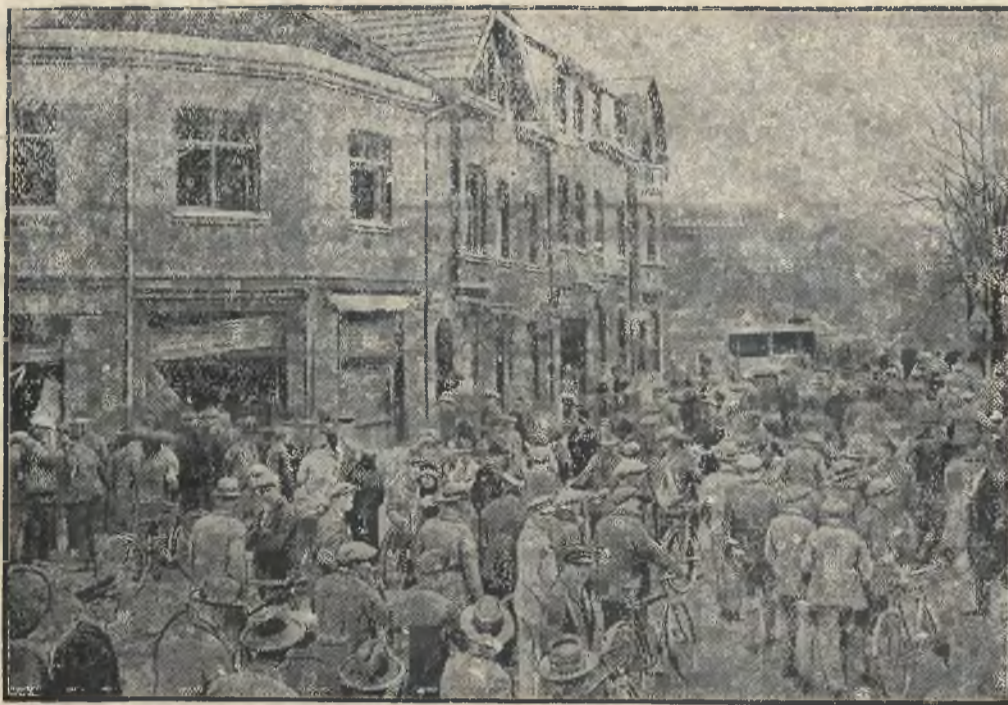
Wzburzenie ludności, która straciła swych bliskich w strasznej katastrofie kopalnianej ujawnia się w rozmowach na temat okropnej tragedji.