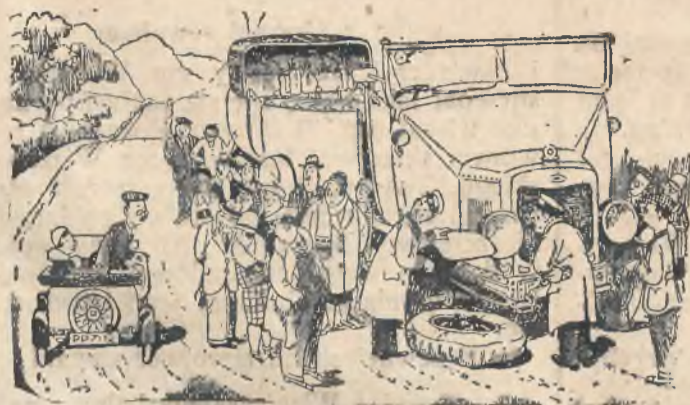
— Czy mogę pomóc?

Nauczyciel — Kiedy zrywa się jabłko z drzewa? Uczeń — Jak właściciel sadu śpi w chacie.