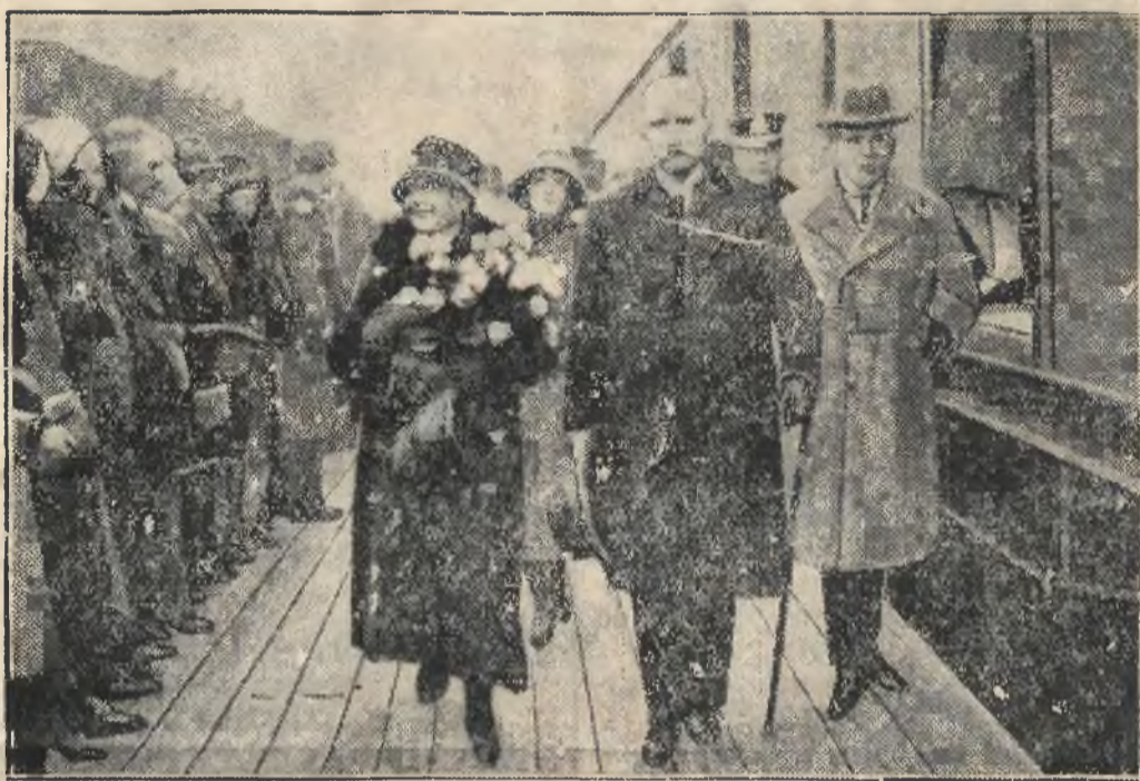
Stahlberg, porwanego przemocą w czasie przechadzki z żoną i uwiecznionego samochodem do granicy rosyjskiej, gdzie został uwolniony. Ludność Helsinków wita oznakami radości Stahlberga w chwili jego powrotu.

Trjumfalny powrót fińladzkiego eksprezydenta