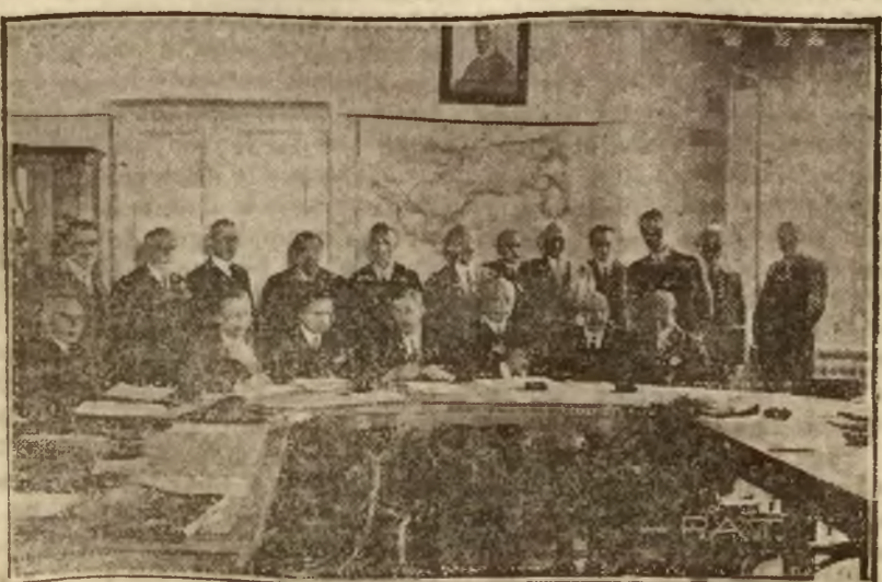
Pierwsze Posiedzenie Państwowej Rady Eksportowej.