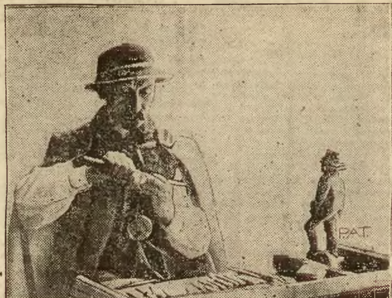
Na wystawie wśród wielu ościowości zwraca na siebie uwagę góral z Zakopanego w swym pięknym stroju, demonstrując zwiędzającym wystawie cudne okazy rzeźby góralskiej.