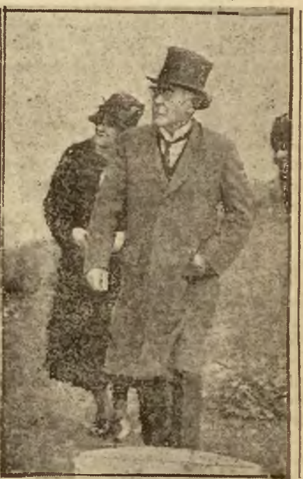
Rudyard Kipling zdradza nieprzemyśleństw do fotografów. Jednak jednemu z nich udało się pochwycić znakomitego pisarza na obiektywie.