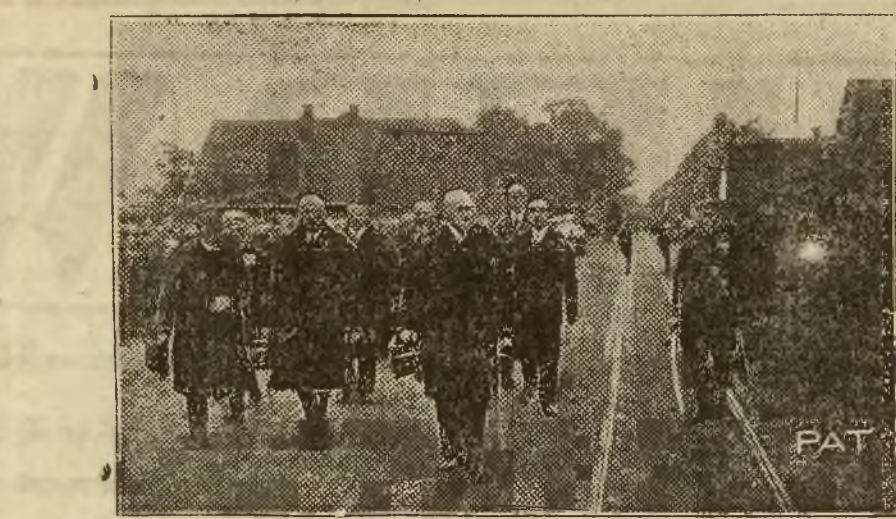
Minister Pracy i Opieki Społecznej, Aleksander Prystor, w Łodzi na uroczystościach święta sportowego klubów fabrycznych.

NANCY, 10.IX. (Pat) Samolot wojskowy, biorący udział w manewrach, odbywających się w Lotaryngji, zapalił się, przyczem porucznik-pilot uległ wgnieleniu, pasażer zaś odniósł ciężkie rany.