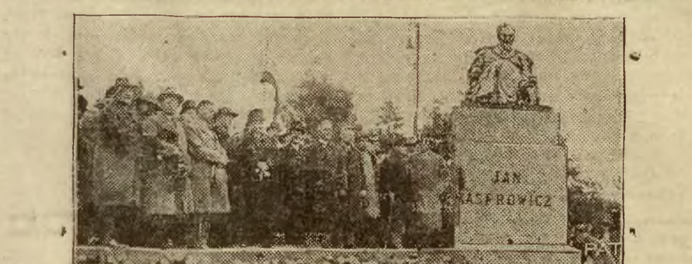
Odsłonięcie pomnika znakomitego poety polskiego, Jana Kasprzowicza, w Inowrocławiu. Obok pomnika stoi reprezentant Pana Prezydenta Rzeczypospolitej, minister oświaty Czerwiński, w otoczeniu przedstawicieli władz i społeczeństwa miejscowego.

Kapitał oszczędnościowy złożony na tych książeczkach wzrósł w ciągu miesiąca o dalszych 3.558.520 zł. i wynosił na ultimo sierpnia b. r. 200.071.282, zaś łącznie z wkładami pochodzącymi z waloryzacji złotych 233.667.402.