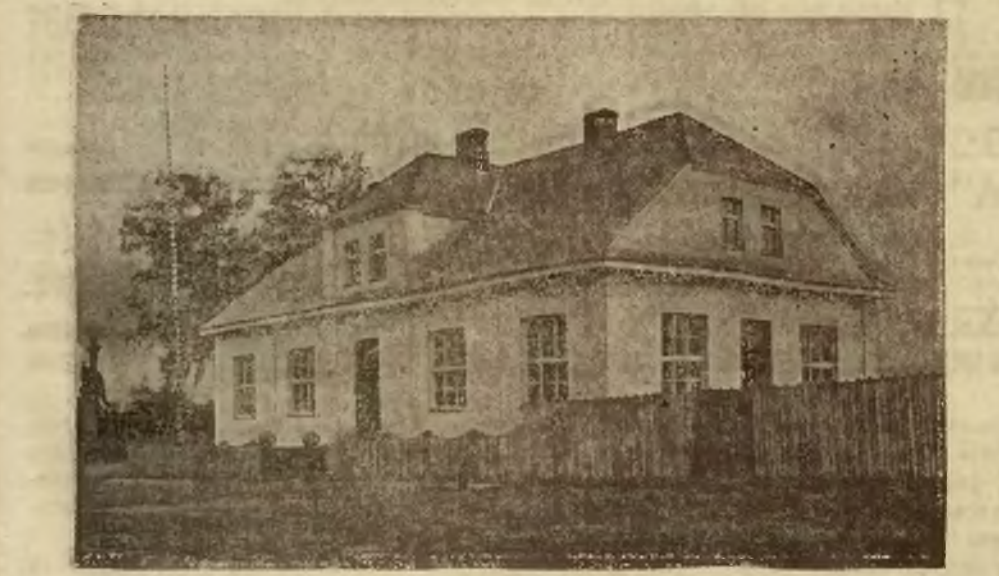
Dom Kasz Stefczyka w Kurzeńcu.