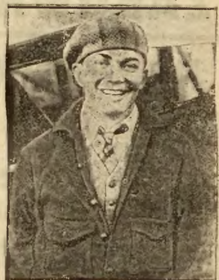
rekordzista długotrwałych lotów (ostatnio utrzymał się w powietrzu 647 godzin)