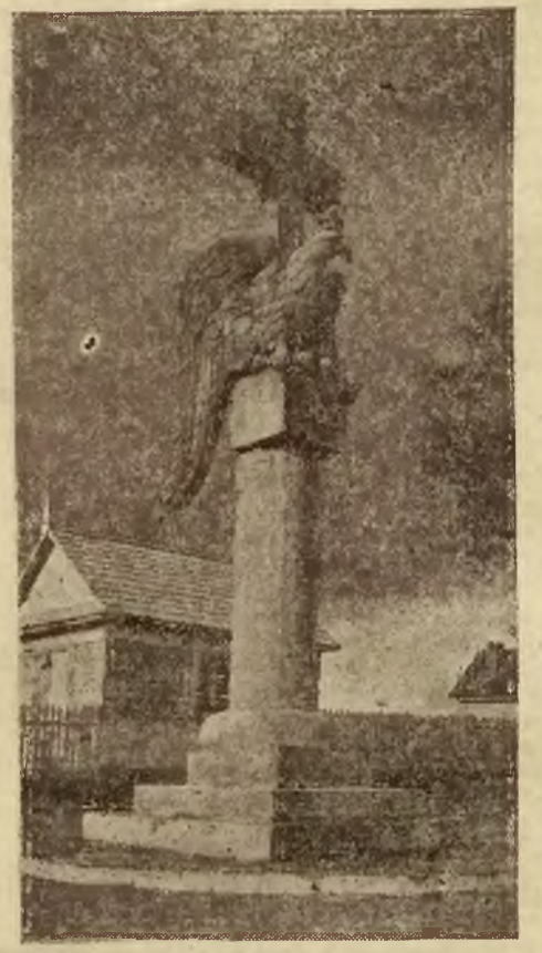
Pomnik ku czci powstańców 1863 roku.