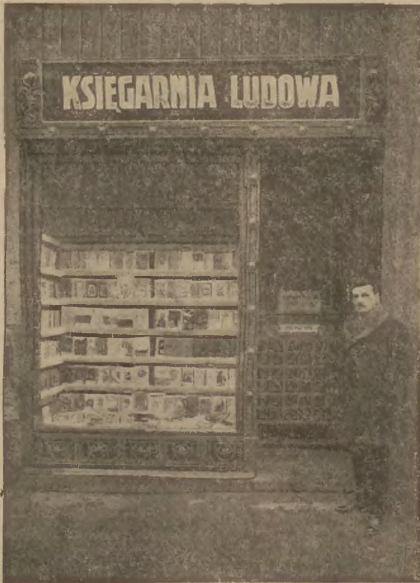
Księgarnia Ludowa przy ul. Szajnochy 2.

Nietylko trudności techniczne stoją na przeszkodzie rozpowszechnieniu pisma. Otwarcie mówiąc, robotnik chętnie robi oszczędności, których unikać powinien. Kultura życia codziennego rodziny robotniczej jest niska, zarobiony grosz nie jest używany właściwie i celowo. Robotnik prowadzi gospodarke domową nieumiejętnie, bez programu. Nie mówimy o pladze alkoholizmu, a wydatki na alkohol poważnie obarczają