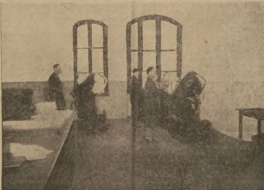
W hali typografów.

Sledztwo w sprawie tych zamachów przeprowadza oddział policji dla spraw politycznych. Wyniki dochodzeń zachowane są na razie w tajemnicy.