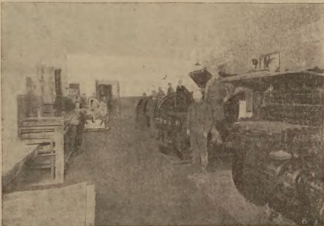
Hala maszyn Drukarni Ludowego Spółdzielczego Towarzystwa Wydawniczego.

Projekt ustawy zostanie zgłoszony na jednym z posiedzeń najbliższych Sejmu.