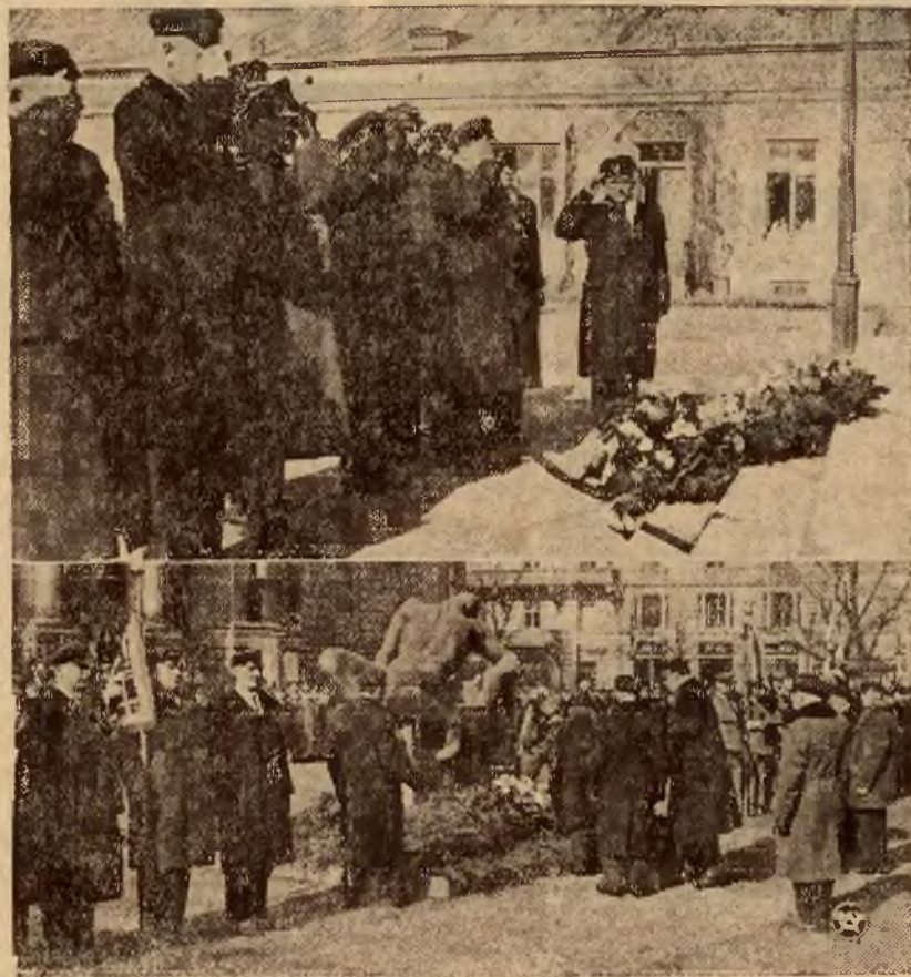
W niedzielę, jako w drugim dniu III-go Ogólnopolskiego Zjazdu Związku Peowiaków delegacja Zjazdu złożyła wieniec na Grobie Nieznanego Żołnierza oraz u stóp Belwederu i pomnika Peowiaka. Zdjęcie nasze przedstawia uroczysty moment złożenia wienca w Belwederze (zdjęcie górne) i przy pomniku Peowiaka.

W godzinach wieczornych nada Polskie Radjo specjalną audycję literacko-muzyczną p. t. „Imieniny Marszałka”. Motywem przewodnim